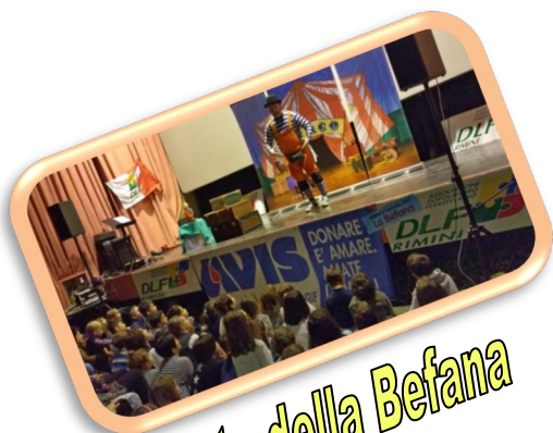
Festa della Befana