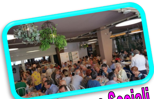
Pranzi e cene Sociali